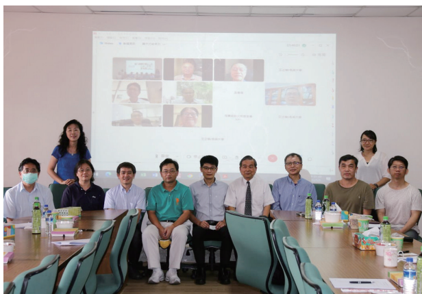
111.05.05 第 12 屆第 4 次董事會議